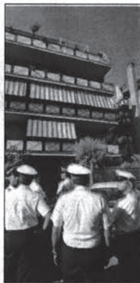
I vigili urbani (foto archivio) hanno fatto irruzione alla sagra di Sant'Egidio di Montecastrilli

All'interno della Taverna mancava un estintore. Invece di tre ne sono stati trovati soltanto due. Stesso discorso per il parcheggio. Anche in questo caso il vigile ha riscontrato l'assenza di estintori. A questo punto la decisione di ritirare la licenza. Agli organizzatori non è rimasto che prendere atto della decisione e chiudere i festeggiamenti in onore del santo patrono con un giorno di anticipo.