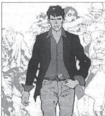
Protagonista Dylan Dog