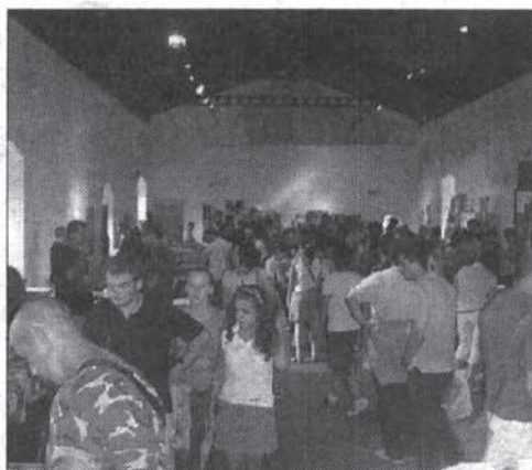
Narnia fumetto Migliaia di visitatori hanno invaso la rocca