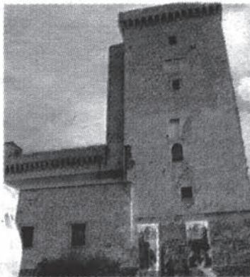
»» La Rocca Albornoz