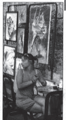
Una giovane e bella pittrice siede davanti ai pannelli in cui sono esposti i suoi quadri a Cavourart

Happy Hour dissacrante ed ironico. Il via è per questo pomeriggio alle 18 e si andrà avanti fino alla fine del mese. Si inaugura la personale del pittore ternano Cristiano Carotti presso l'art shop restaurant Zenzero di via Fratini. La carrellata si presenta come una carrellata ironica del rito dell'aperitivo, momento culmine delle pubbliche relazioni, passerella del quotidiano apparire. La personale di Carotti è composta da un'opera realizzata su tela e da una serie di tecniche miste su carta nelle quali il pittore racchiude alcune delle immagini diventate ormai parte del proprio patrimonio. Gli appuntamenti con Cavourart proseguono anche dopo cena con il concerto "Bach e Bergman, spettacolo musicale che si terrà a palazzo Gazzoli a partire dalle 21. Alle 22 a largo Mazzancolli Happy Hour tour varietà tra aforismi sull'arte, ballerini, musica dal vivo e vignette.